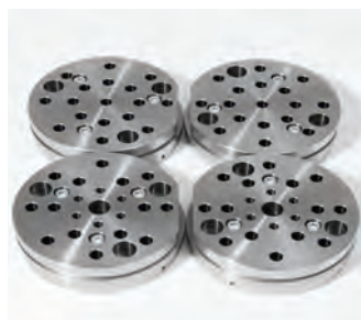
Fabricação de moldes