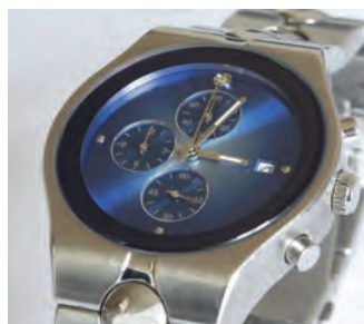
Relojoaria e joalheria