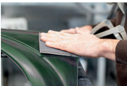
Reparação do automóvel