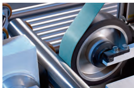
Rectificação sem centro de tubos