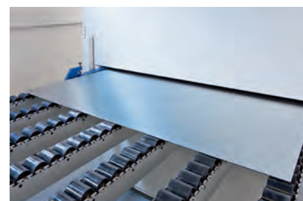
Lixagem a seco