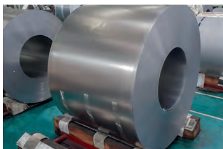
Processamento de bobinas