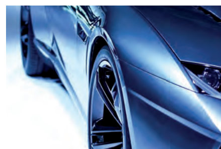
Indústria do automóvel | Remoção de defeitos de lacagem