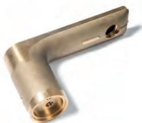
Indústria de ferragens