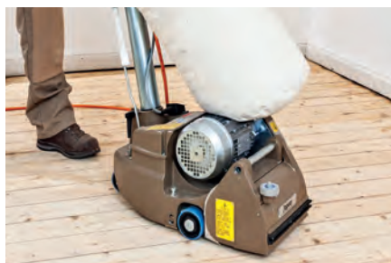
Restauração de solos | Lixadeiras de rolo