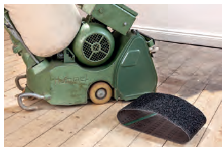
Restauração de solos | Lixadeiras de cinta