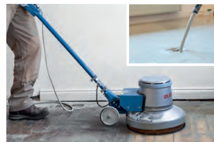
Restauração de solos | Lixadeiras de disco Camada de anidrite | Lixagem plana