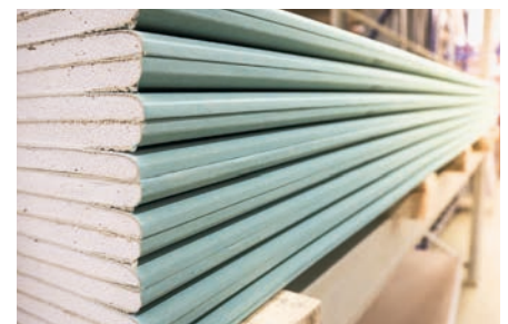
Placas de gesso e fibrocimento