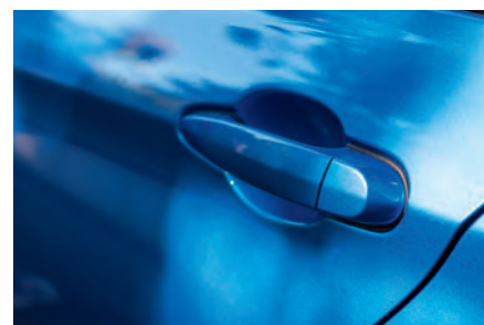
Pega plástica da porta do carro