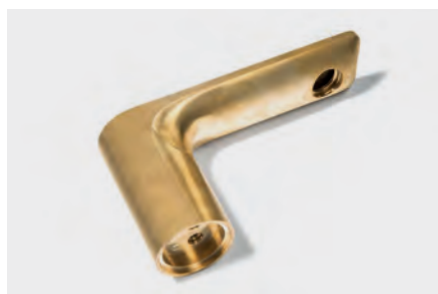
Indústria de ferragens