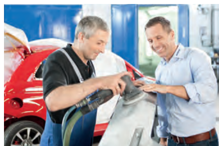
Oficinas de chapa e pintura