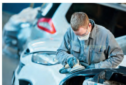
Lixagem de verniz