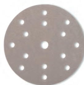
Variante de cor #2000 / ST3000