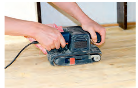
Lixadeiras de cinta para o tratamento da madeira