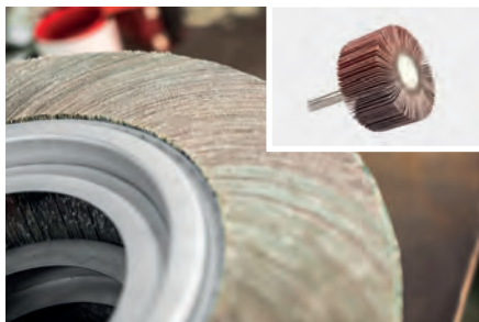
Material base para escovas de lâminas com haste e furo