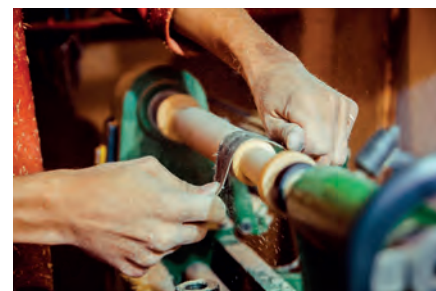
Lixagem manual geral - Tratamento da madeira