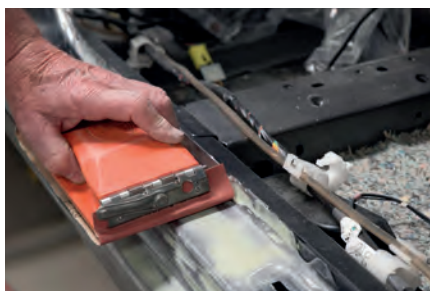
Lixagem manual - Carroçaria