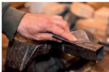
Lixagem manual geral - Metalomecânica