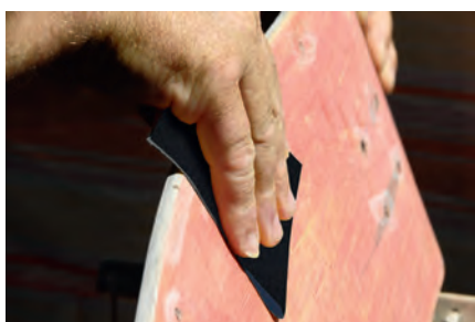
Móveis e madeira em geral