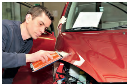
Reparação do automóvel