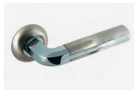
Ferragens e puxadores