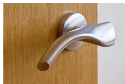
Ferragens e puxadores em alumínio