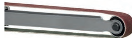
Cintas abrasivas para lixadeiras eléctricas e pneumáticas