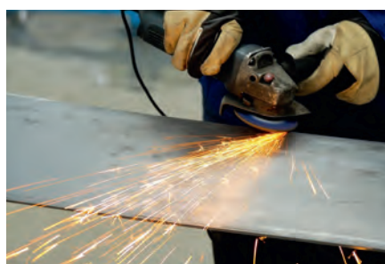
Maquinagem de chapas de aço