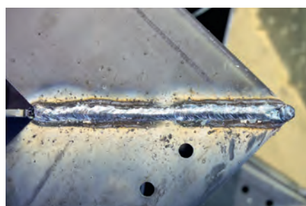
Revisão de juntas de soldadura