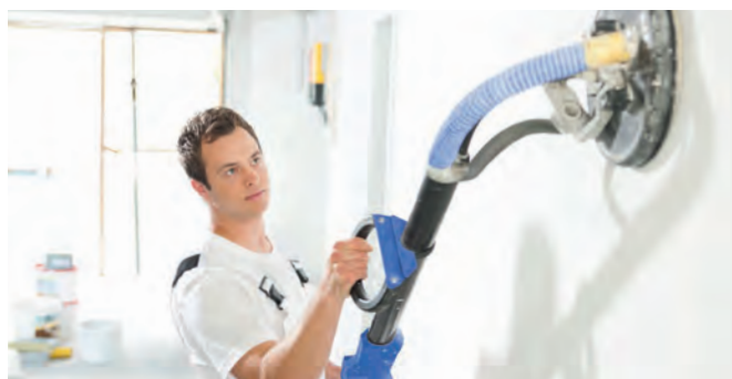
Pintores e construção a seco