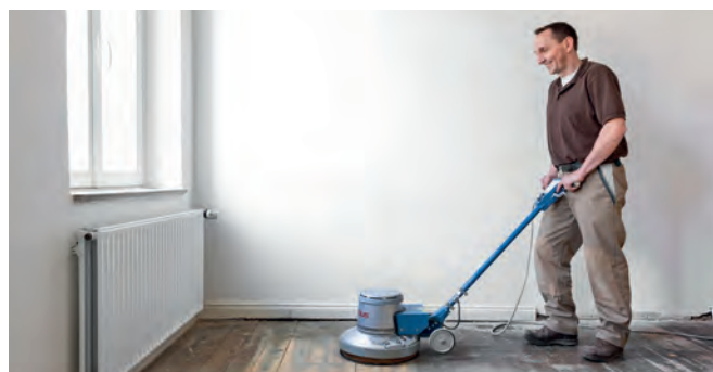
Indústria do parquet