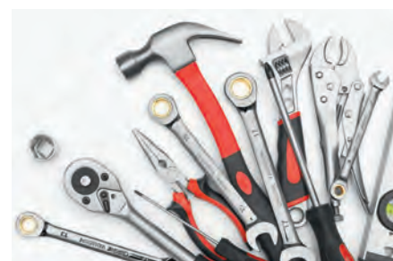
Fabrico de ferramentas