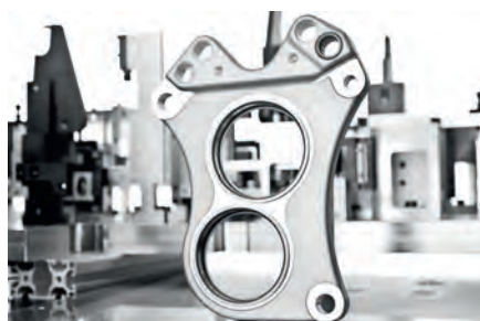
Peças fundidas em alumínio