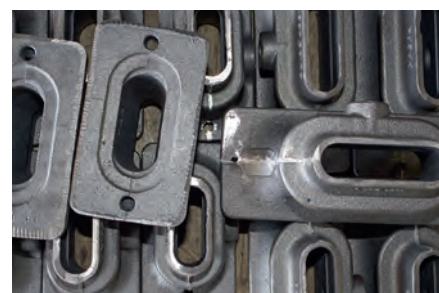
Rebarbamento de peças fundidas