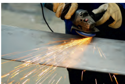
Maquinagem de chapas de aço