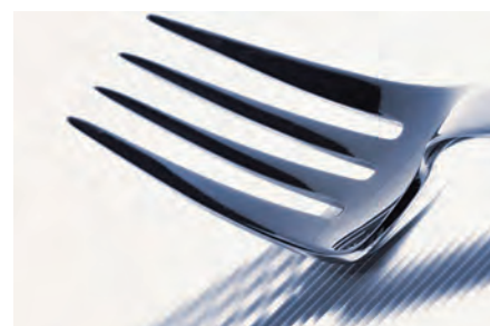
Fabrico de cutelaria