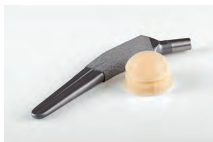
Fabrico de implantes