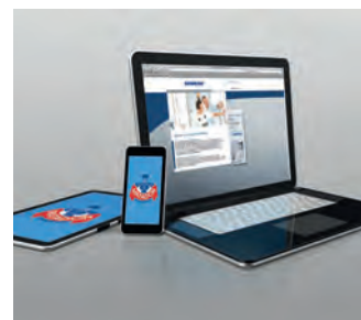
Industria de la electrónica