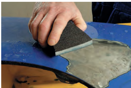
Reparación del automóvil