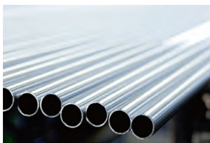
Lijado de tubos redondos y rectangulares