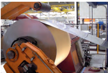
Tratamiento de bobinas y chapa gruesa