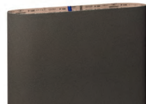
Tratamiento del vidrio - achafanado