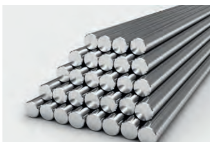
Rectificado de aceros redondos y planos