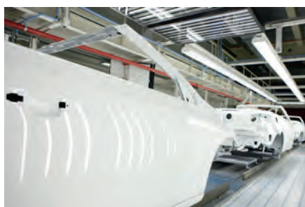
Industria del automóvil