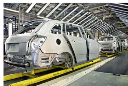
Eliminación del exceso de PVC