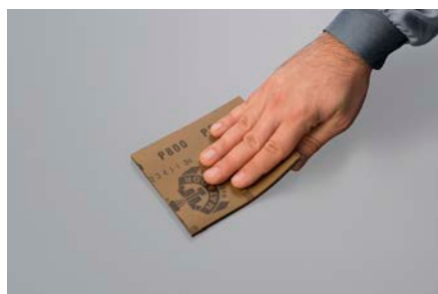
Industria del automóvil - Lijado de KTL