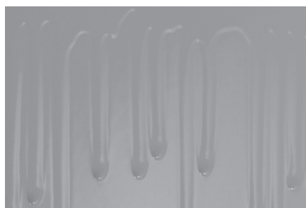
Eliminación de goterones