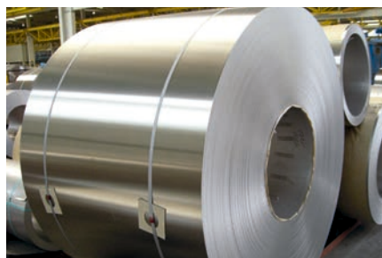
Lijado de bobinas y chapa fina de acero