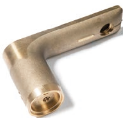
Industria de herrajes