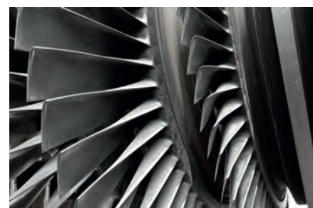
Álabes de turbinas