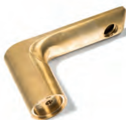
Industria de herrajes