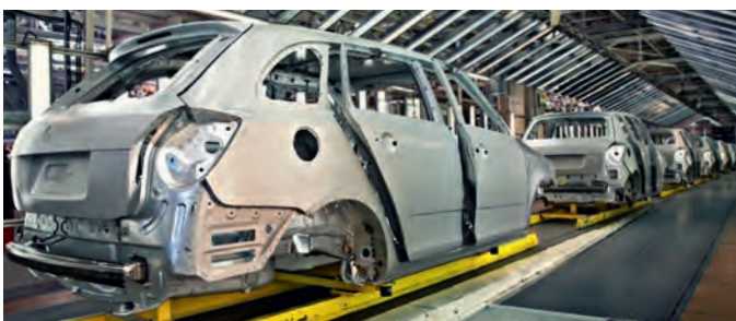
Industria del automóvil - Masillas