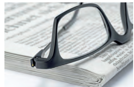
Industria de la óptica | Vidrio para gafas