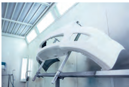
Reparación del automóvil