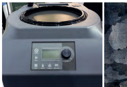
Industria del acero y metalurgia