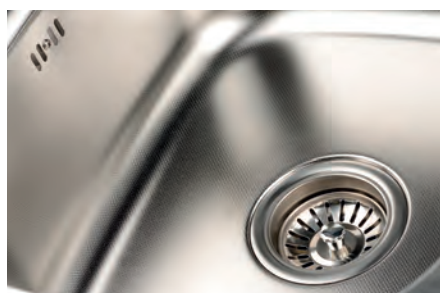
Fregaderos de acero inox