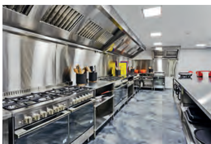
Cocinas industriales de acero inox