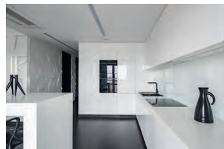
Muebles de cocina de alto brillo