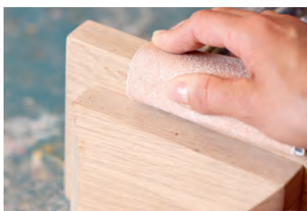
Lijado a mano en la industria de la madera