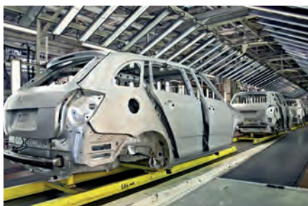
Industria del automóvil | Imprimación KTL