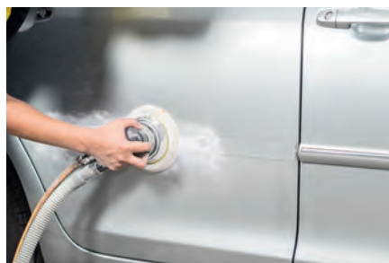
Reparación del automóvil