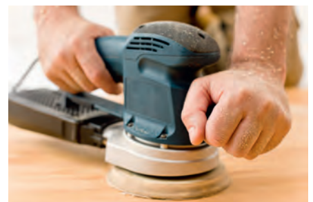
Industria de la madera y del mueble