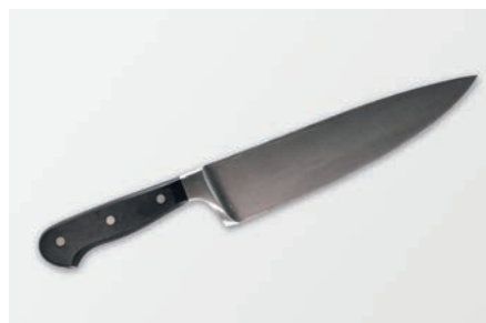
Cubertería y cuchillos