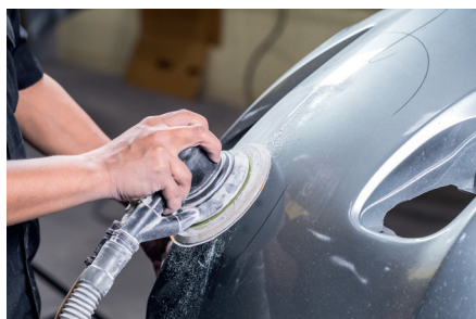
Reparación del automóvil