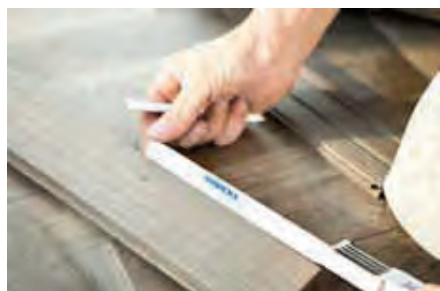
Parquet sin tratar