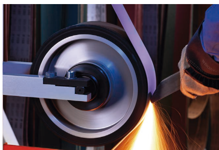
Desbarbado de acero | Eliminación del bebedero