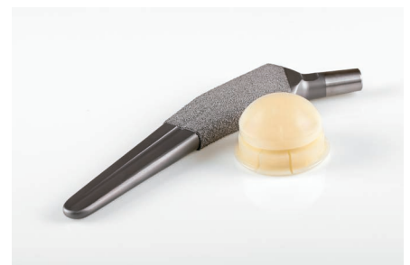
Implantes & tecnología médica | Tratamiento de piezas brutas