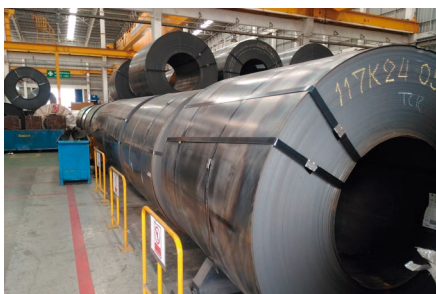
Bobinas | Eliminación de la herrumbre y de la cascarilla de laminación