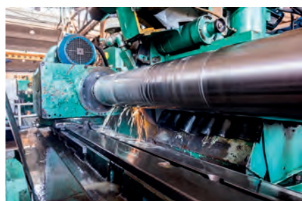
Rectificado en húmedo de rodillos y cilindros