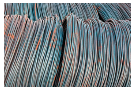
Eliminación de la herrumbre de alambre con lijado en seco